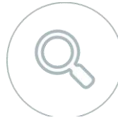
Gráfico de puntajes